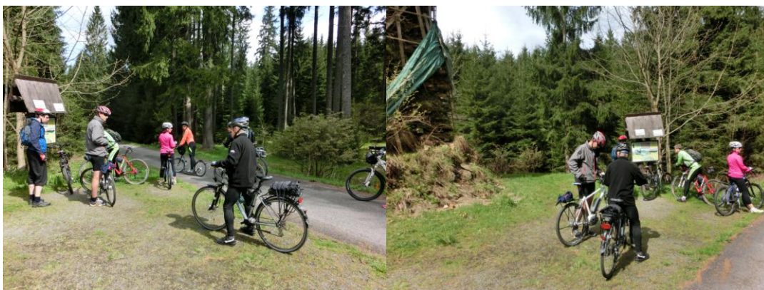
Účastníci cyklojízdy uprostřed přírody Jeseníků