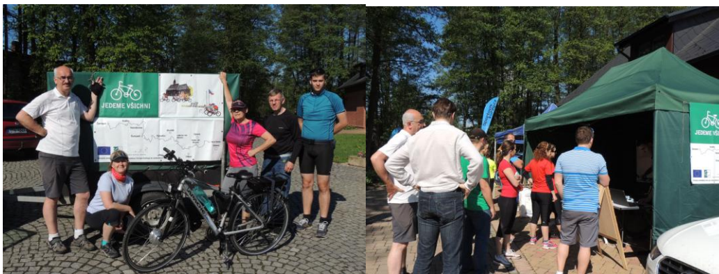
Start cyklojízdy - Zastavení Lhota, Háj ve Slezsku (MAS Opavsko).