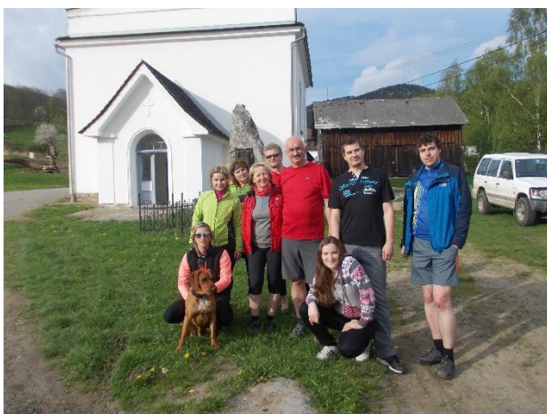
Kunčice, zastavení 10.5.2015

Ramzová. Kola a nohy spočinou. Seznámíme se s kolemjdoucími a kolemjdoucími, zda by je zajímala elektrifikace cykloturistiky, protože přeci Jedeme všichni.