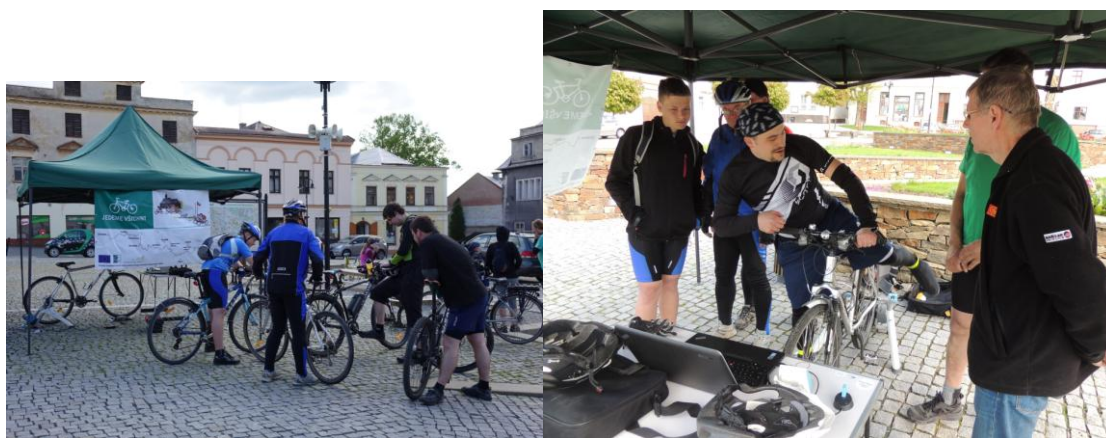
Zastavení Horní Benešov (MAS Hrubý Jeseník).

Obě skupiny cyklojízdy se setkaly na zastavení v Horním Benešově, kde byly společně propagovány cíle projektu.